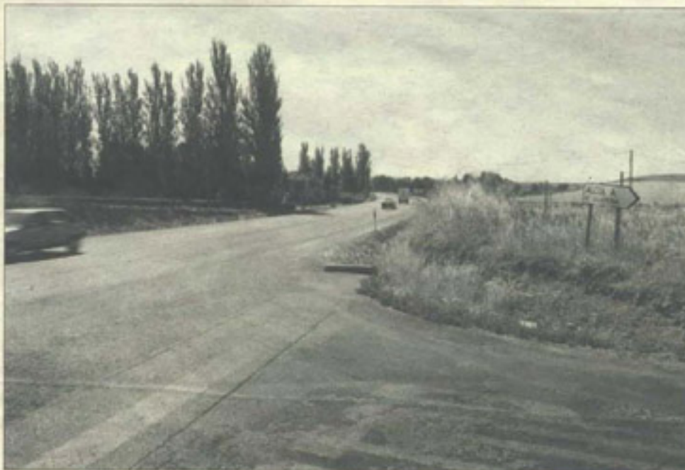
Imagen actual de la intersección, considerada por muchos como punto negro en la carretera.

► APRUEBAN EL PROYECTO DE INTERSECCIÓN DE LA N-430 CON EL ACCESO A ALCOLEA